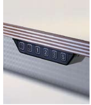
Memory-Tasten für noch mehr Komfort.