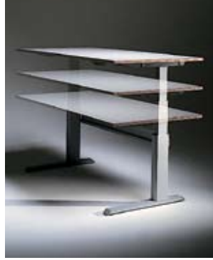
Elektrische Höhenverstellung von 68 cm bis 135 cm.