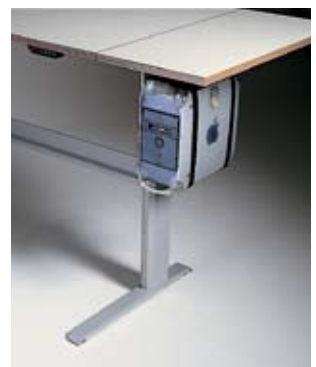
Anbauelemente für zusätzliche Arbeitsfläche. Mitfahrende CPU-Halterung.