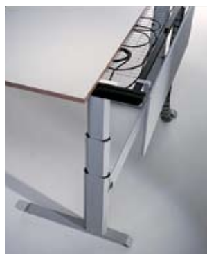
Stauraum für optimale Ordnung bei der Verkabelung.

Ein breit gefächertes Tischplattensortiment gehört bei Stilo zum Standard. Exklusiv bei Stilo: Konkave Arbeitsplatten in verschiedenen Oberflächen mit ERGO-Kante.